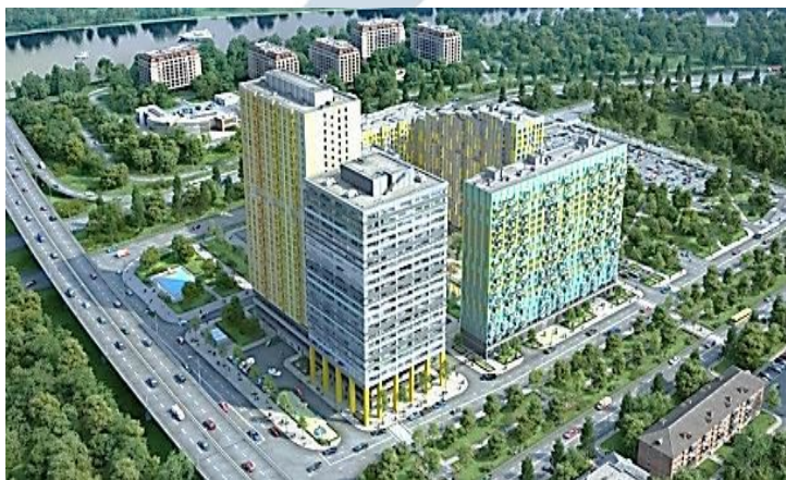
ЖК «Фили Град» Москва, Береговой проезд, вл. 5