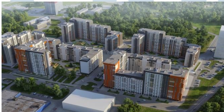
район Северное Бутово Москва, ЮЗАО, Феодосийская, вл. 1