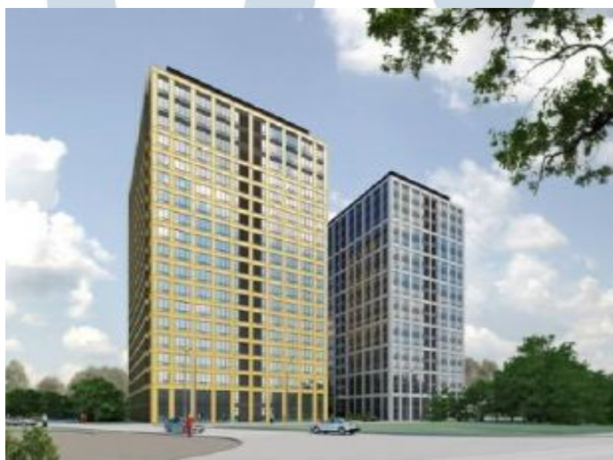
«Савеловский Сити» многофункциональный офисно-деловой центр (г. Москва, ул. Складочная, вл. 1)

Отделение Пенсионного фонда Российской Федерации по г. Москве и Московской области (г. Москва, ул. Стасовой, д.14, корп. 2)