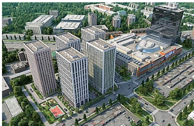
«Многофункциональный комплекс» Москва, Головинское шоссе, вл. 5